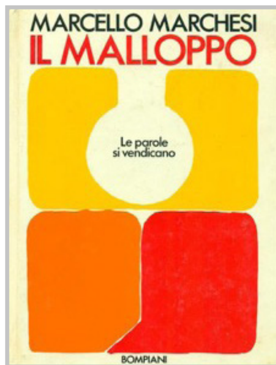
Copertina de Il Malloppo di Marcello Marchesi (prima edizione 1971)

Fin dalle prime pagine le due autobiografie denunciano l’inautenticità dell’operazione che il lettore si appresta a leggere. Il carattere finzionale del Malloppo , ad esempio, viene implicitamente dichiarato attraverso una nota introduttiva al testo, ovvero in uno spazio esterno (o laterale) alla narrazione che dovrebbe pertanto conferire maggiore validità alle parole dell’autore: «la presente trascrizione dei nastri magnetici registrati dall’A. nel