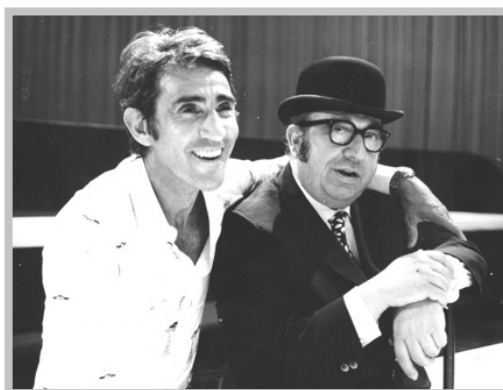
Walter Chiari e Marcello Marchesi

Marcello Marchesi e Walter Chiari si incontrano nel 1947, e da quell'anno ha inizio una collaborazione che interseca al contempo il teatro, il cinema 2 e, in tempi successivi, la televisione. Tra i diversi autori che hanno avuto modo di scrivere testi per Chiari, Marchesi risulta fin da subito il più adatto a trattare e ad arginare l'inesauribile e generoso flusso di parole dell'attore. L'autore milanese, in sostanza, sembra parlare la medesima lingua di Walter Chiari, tanto da divenirne una sorta di controfigura; sono ormai noti, infatti, i racconti legati ai proverbiali ritardi e alle vere e proprie sparizioni di Chiari nel corso dei suoi spettacoli teatrali, così come sono passate agli annali le improvvisate sostituzioni dell'attore compiute da Marchesi stesso. Del resto quest'ultimo era tra i pochi a perdonare all'attore la sua «infantile incapacità alla puntualità e alla osservanza di tutte le altre meschine esigenze della vita che vive maldestramente e da cui non si sa difendere». 3