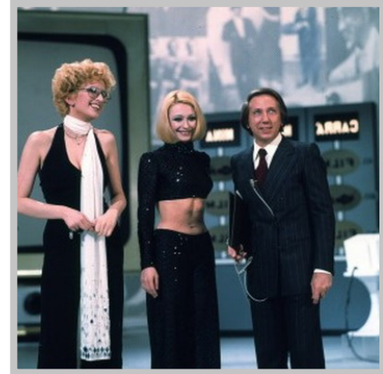
Mina e Raffaella Carrà con Mike Buongiorno nella quarta puntata, dedicata alla televisione (6.04.1974)

Alla fine di questo «processo al video sesso», Alberto Lupo scherza sull'ombelico della Carrà prima di introdurre le gemelle Kessler che si esibiscono in un brano danzato, rivolto al voyeurismo maschile, che gioca sull'esposizione delle gambe. Al termine della canzone le gemelle vengono raggiunte da Raffaella e Mina. In una sorta di recitativo, con un cromatismo discendente marcato, le quattro donne (con un raddoppiamento della coppia delle presentatrici) introducono un nuovo pezzo che esplicitamente allude al fascino prodotto sugli spettatori dalla loro presenza schermica: la canzone Che cosa (di Gianni Ferrio e Roberto Lerici):