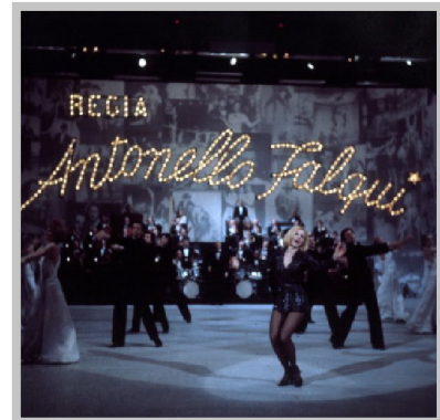
Raffaella Carrà nel balletto della sigla di testa del programma

Il «mito» della Carrà propone, invece, valori diversi e a sfondo prevalentemente vitalistico: la volontà, l'ambizione, l'indipendenza, l'entusiasmo, l'amicizia, l'amore per i bambini, l'attaccamento al proprio lavoro (il «fiatone» dopo il balletto) e un pizzico,