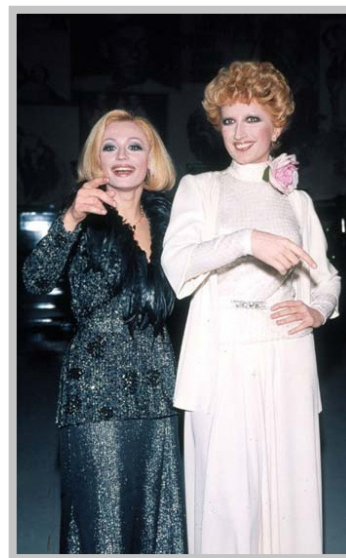
Le protagoniste di Milleluci , Mina e Raffaella Carrà

Raffaella Pelloni arriva a Milleluci dopo un apprendistato presso il Centro Sperimentale di Cinematografia, dopo aver recitato in film e sceneggiati televisivi, e soprattutto