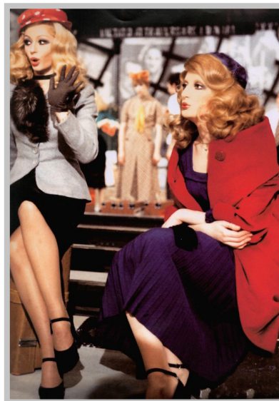
Mina e Raffaella Carrà nella puntata dedicata all'avanspettacolo (20.04.1974)

Insomma: l'operazione con cui vengono rivitalizzati i generi e le forme dello spettacolo è quella di uno sguardo metalinguistico che filtra tutto attraverso un'ironia leggera e accorta, incarnata dalla capacità delle due vedette di scherzare su se stesse. In tal modo le due donne non solo richiamano al pubblico una più o meno sopita memoria dello spettacolo, ma suggeriscono 'come' riappropriarsi del passato attraverso la mediazione (consapevole ma canzonatoria) del loro sguardo e del loro corpo. Accanto a Mina e Carrà vi sono i protagonisti della storia di ciascun genere, ove possibile, nel ruolo di se stessi, autentici