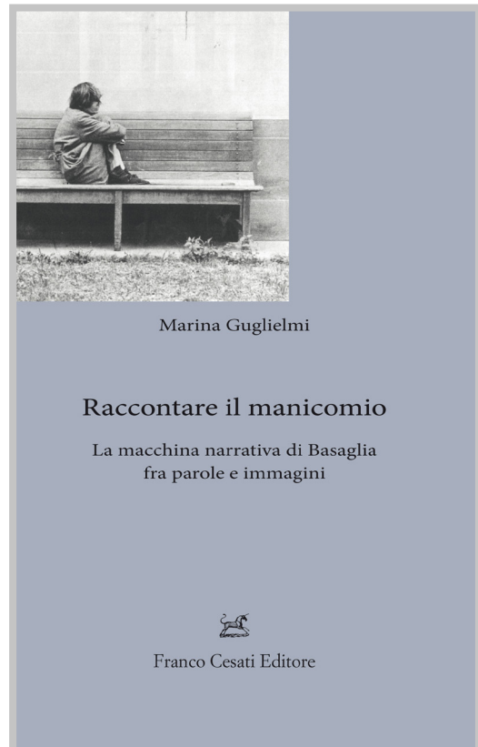
copertina di Raccontare il manicomio. La macchina narrativa di Basaglia tra parola e immagine

Dopo un'incursione sulle risposte cinematografiche suscitate dall'opera di Zavoli – tra cui Fortezze vuote di Gianni Serra (1975) e Nessuno o tutti di Marco Bellocchio (1976) –, il