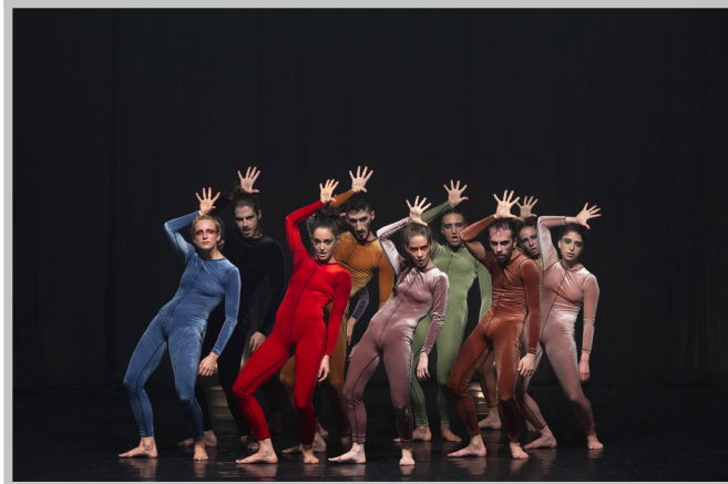
Rifare Bach @Salvatore Pastore