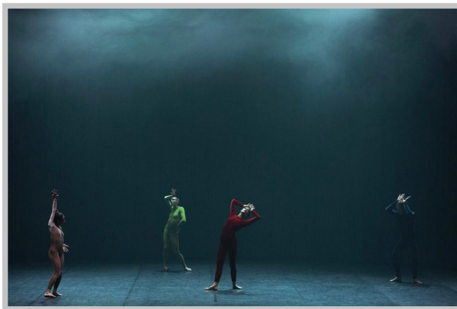
Rifare Bach

considerava il ritorno alle opere di Bach «legato alla riscoperta della dimensione pratica del fare musica», nel 1987, ossia due anni prima della caduta del muro di Berlino, John Cage invitava a «lasciar perdere Bach» poiché musica incapace di rappresentare la com-