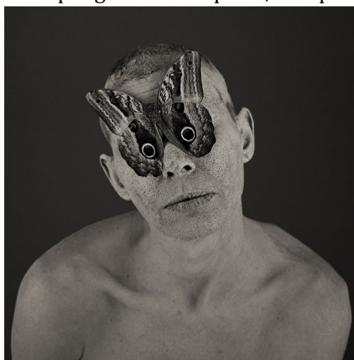
Roberto Kusterle, Lenti a contatto , 2004, dalla serie I riti del corpo

La tematizzazione delle interdipendenze e il carattere 'inclusivo' delle serie, che rende al tempo processuali e strutturali tali interdipendenze, hanno indotto i curatori della mostra a disegnare un percorso plurivoco: gli itinerari possibili si intrecciano e rinfrangono da una parete all'altra, da un locale all'altro (con l'eccezione dei video e di L'abbraccio del bosco : quest'ultima, soprattutto, ha richiesto una sala più appartata). Le fotografie, in grande formato, dai colori terrosi, propongono un incontro a dimensioni naturali, fortemente empa-