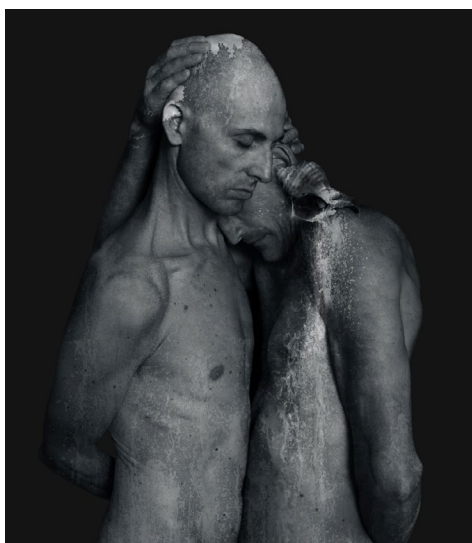
Roberto Kusterle, Il conforto , dalla serie Abissi e basse maree