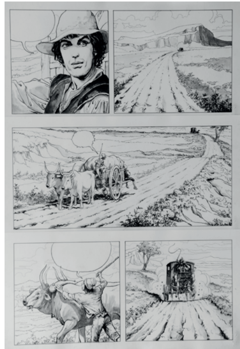
Caravaggio, Tavola inedita di prossima pubblicazione, china 2013©Salvo Grasso

La vita di Caravaggio sarà narrata (con testi dello stesso Manara, scritti dopo il completamento della storia disegnata) attraverso il racconto delle relazioni che ebbe con diverse donne, quasi si trattasse di un'appendice al discorso già avviato nel 2000 col libro di illustrazioni Il pittore e la modella , in cui la storia dell'arte veniva rubricata attraverso le dina-