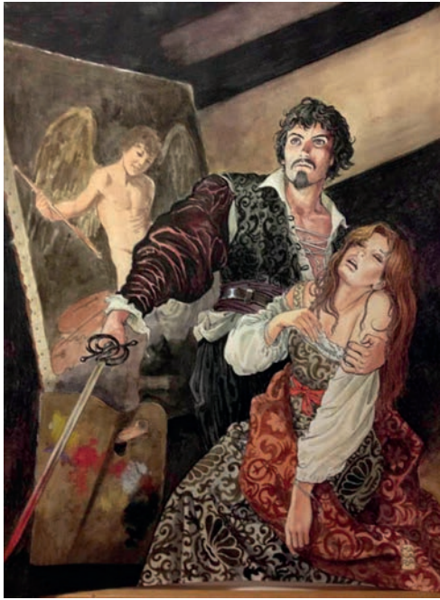
Caravaggio, Tavola inedita di prossima pubblicazione, china 2013©Salvo Grasso

amiche di ispirazione e seduzione fra artista e musa. Caravaggio 'usava' le modelle in modo scandaloso per la sua epoca: si pensi ai ritratti di donne fustigate, come la Anna Bianchini modella per la Maddalena penitente , o di donne morte, come Fillide, annegata e ripescata dal Tevere, modella per La morte della Madonna . È nei confronti di queste donne, secondo Manara, che dovremmo avere una gratitudine immensa e così il suo lavoro non è altro che un «piccolo tentativo di risarcimento».